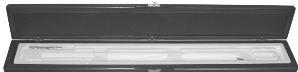
Футляр для ППО, ПРО (кожа, дерево)