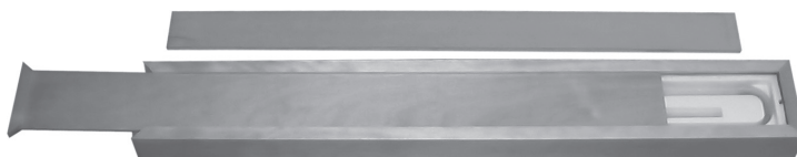
Пенал для ППО, ПРО (дерево)